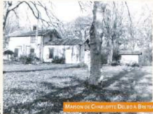
Association Charlotte Delbo

Inscription préalable conseillée auprès du Centre Social des Bergeries ou auprès de la bibliothèque Charlotte Delbo.